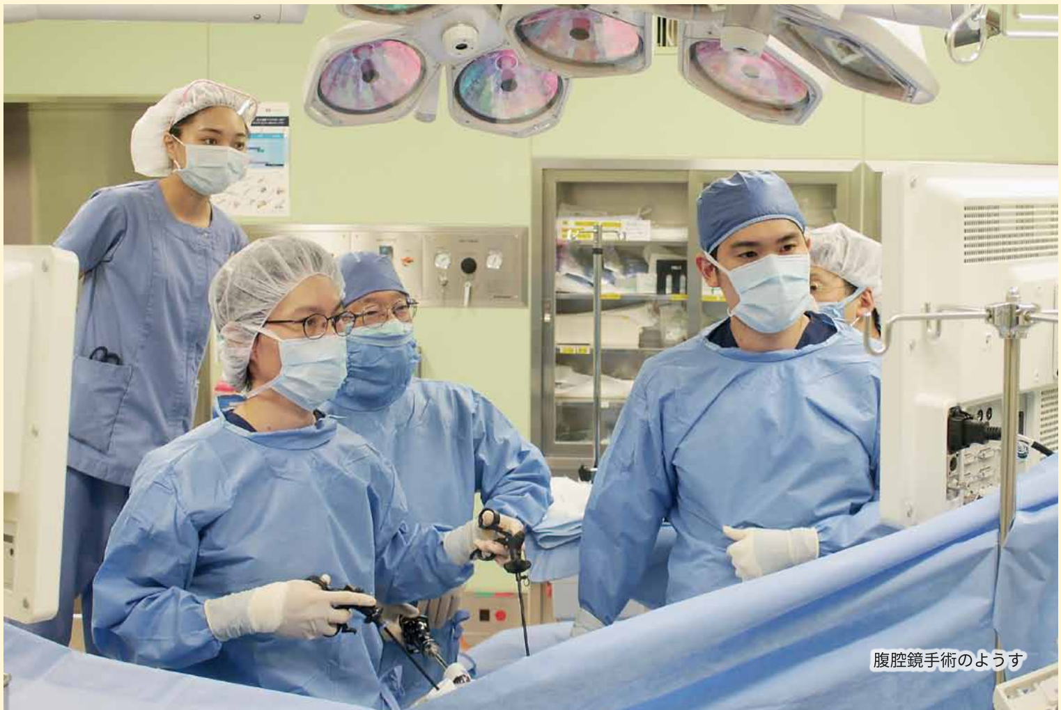
腹腔鏡手術のようす

私たちは、地域中核病院として、医の倫理を基本に、質の高い医療と優れたサービスをもって、住民の健康を守り、地域の発展に尽くします。