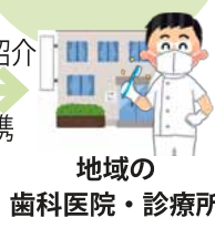
地域の 歯科医院・診療所