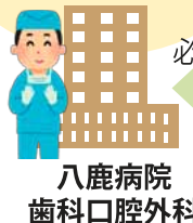
八鹿病院 歯科口腔外科