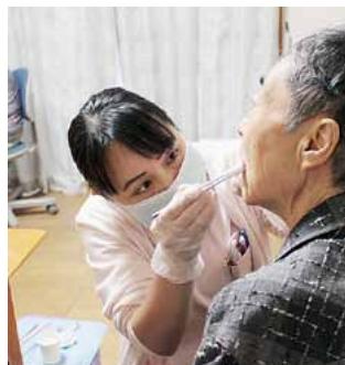
患者さん宅を訪問し口腔ケアをおこなう歯科衛生士

かかりつけの歯科医院がない方に対して、一般歯科医院でおこなうような歯科治療（虫歯、歯周病、冠義歯）をおこないます。また、かかりつけ歯科への受診が困難な方のために、ご自宅への訪問診察や口腔ケアにも対応しています。患者さんには、病気に對する十分な説明をおこない、同意のもとで納得のいく治療がおこなえるように心掛けています。