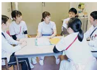
リハ栄養グループミーティングの様子

今後もグループ活動を通じて看護師としてのスキルアップができるように活動を行っていきたいと思います。