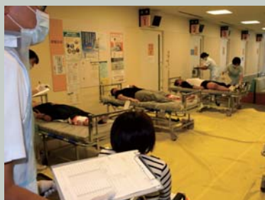
黄 = 中等症者