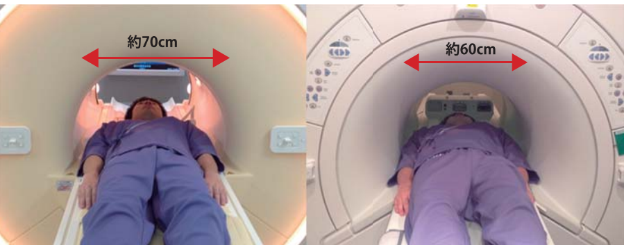
開口径が70Cmと広く、快適に検査が受けられます。

最新の映像システムを搭載して、時間経過や検査を受けていることを忘れてしまうほどリラックスできます。お子さんや今までMRI検査が苦手な方も、安心して検査を受けて頂く事が可能となりました。実際、いびきをかかれて寝ながら検査を受けておられる方もつとアニメを見ながらと言った子供さんもおられ、その快適さを