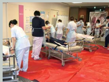
赤 = 重症者

災害時等、多数の傷病者が一度に発生する状況下では、傷病者の緊急性や重症度に応じて優先度を決定し、治療に当たります。