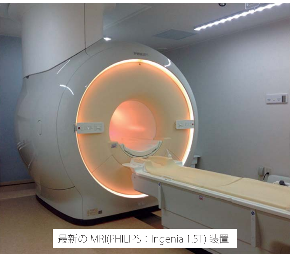
最新のMRI(PHILIPS : Ingenia 1.5T) 装置

日々感じて検査にあたっていきます。また、最新の検査技術も多彩に搭載されていて、動きによる補正や分解能の向上、心臓検査も行えるようになりました。この最新のMRI装置で、たくさんの方々に検査を受けていただき、病気の発見に役立てて行きたいと思っています。皆さん、MRI検査はぜひ八鹿病院で受けて下さい。よろしくお願います。