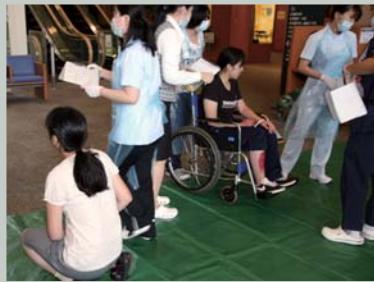
緑 = 軽症者