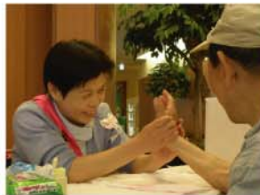
アロマオイルのいい香りにつつまれながらのハンドマッサージ。