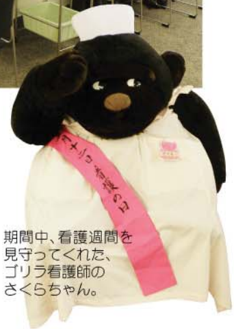
期間中、看護週間を見守ってくれた、ゴリラ看護師のさくらちゃん。