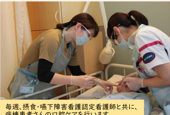
毎週、摂食・嚥下障害看護認定看護師と共に、病棟患者さんの口腔ケアを行います

歯科衛生士が入院中に介入することで、歯科への通院が困難なために放置されていた義歯によるトラブルや不具合なども早期に気づき、患者さんの食べる機能を守り、ADLを向上させることができていると感じます。今後も、医師や看護師等他の職種とも連携し、口腔ケアに取り組んでいきたいと思っております。