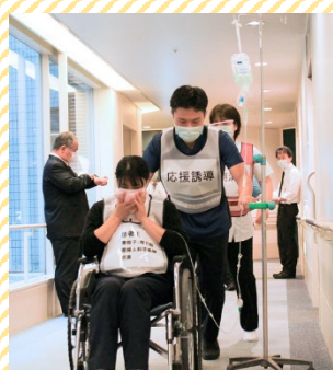
(左)他部署の職員は院内各所から火元階へかけつけ、避難誘導します

消防訓練を行うことで、患者さんの安全を確保し、すばやい対応がもとめられる現場において、いかにスムーズに対応できるかを再認識できました。