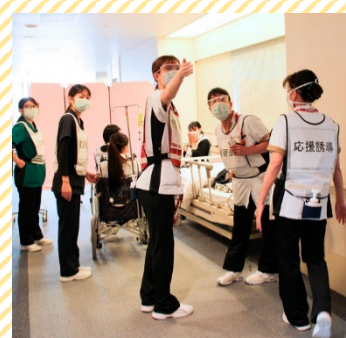
(右)スムーズな水平避難ができました