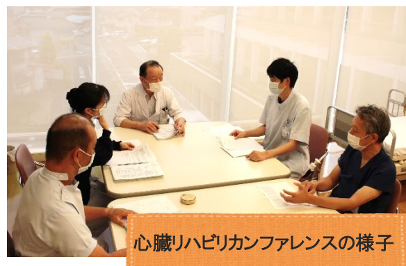
心臓リハビリカンファレンスの様子