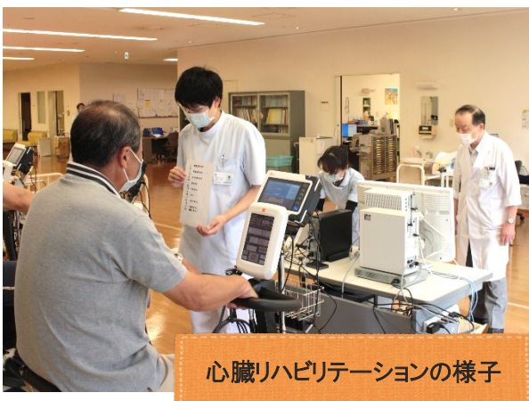
心臓リハビリテーションの様子