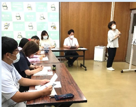
地域ケア個別会議の様子

高齢化は但馬の大きな問題です。地域の課題を、各専門職と事例検討を行うなどしながら、共に考えています。ご家族や地域の方の協力、ネットワークづくりを意識し地域に貢献できるよう努力しています。