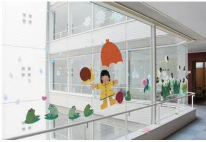
雨の日にもぎやかです

総合診療科・救急科よりお願い ※当日紹介および救急への紹介は、直接総合診療科の担当医師へ電話連絡のうえ、患者情報のFAX送信をお願いします。スムーズな受診のため、よろしくお願いいたします。