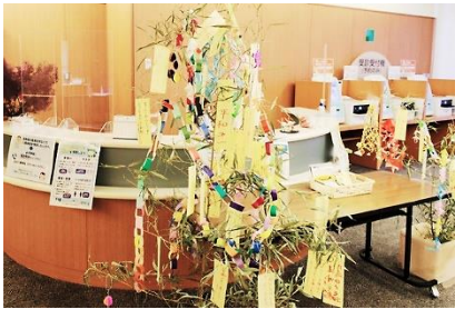
今年もたくさんの願いをのせた 七夕かざりとなりました