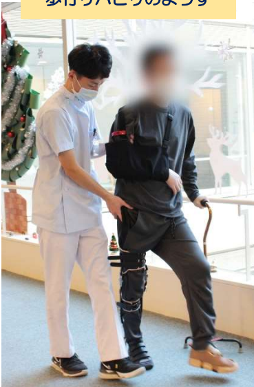
歩行リハビリのようす

理学療法士、作業療法士、言語聴覚士が病状によって適宜介入します。元の生活に戻られることを目標に、患者さんの残された機能を最大限に引き出すお手伝いをします。