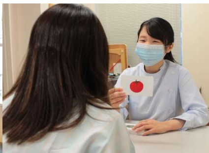
言語聴覚士による言語療法のようす

理学療法士、作業療法士、言語聴覚士が病状によって適宜介入します。元の生活に戻られることを目標に、患者さんの残された機能を最大限に引き出すお手伝いをします。