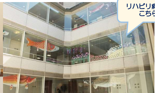
リハビリ病棟はこちら