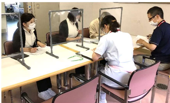
退院前カンファレンス