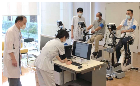
エルゴメーターでの心臓リハビリ

■心リハ参加をご希望の患者様がいらっしゃいましたら、ぜひ公立八鹿病院循環器内科外来または地域医療連携室(電話：079-662-5555)までご紹介いただければ幸いです。