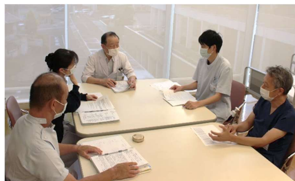
心臓リハビリのカンファレンスの様子