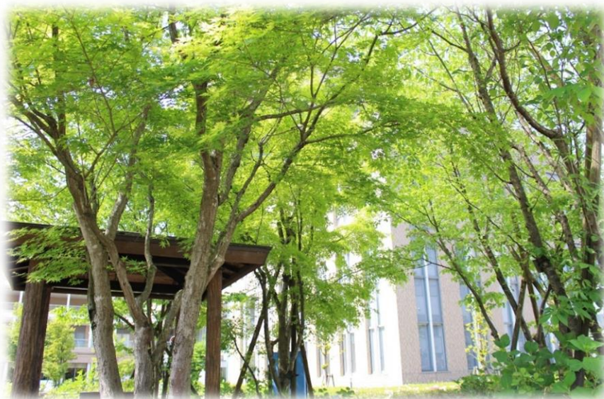
八鹿病院 西玄関リハビリ庭園