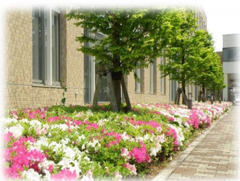
八鹿病院 南側花壇